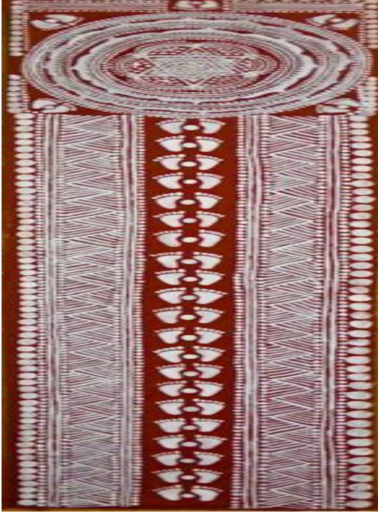
लक्ष्मी पग ऐपण

उपरोक्त ऐपणों को पूजा पाठ, जनेऊ संस्कार एवं विवाह संस्कारों में प्रयोग किया जाता है। बिना लक्ष्मी के पगचिन्हों के ऐपण अधूरे माने जाते हैं। ऐपण कला कपड़ों पर भी की जाती है। रंगवाली पिछोड़ा मुख्यतः उत्तराखण्ड कुमाऊँ की पहचान है। पहले यह पिछोड़ा सफेद कपड़े को हल्दी के रंग से रंगने के उपरान्त उस पर रोली आदि से अल्पना लेखन किया जाता था। वर्तमान में रंगवाली पिछोड़े के अतिरिक्त ऐपण साड़ी व अन्य परिधान भी उपलब्ध होने लगे हैं।