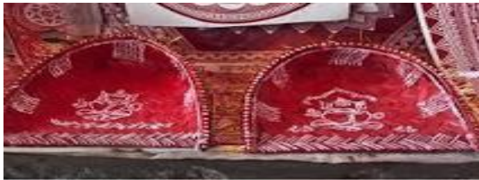
सूप पर ऐपण