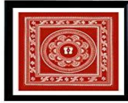
कपड़े में बनी गणेश लक्ष्मी चौकी

श्री सुधीर चन्द्र नौटियाल, निदेशक, उद्योग विभाग, उत्तराखण्ड का कथन है कि ऐपण डिजाइन की बाजार में माँग बढ़ रही है। ऐपण डिजाइन से तैयार उत्पादों को काफी पसंद किया जा रहा है। यहाँ तक कि नए बन रहे भवनों की दीवारों पर टेक्चर की जगह ऐपण को लगाया जा रहा है। युवाओं को प्रशिक्षण व नए डिजाइन बनाने के लिए हल्द्वानी व अल्मोडा हब के रूप में विकसित हो रहे हैं। ऐपण उत्पादों को राष्ट्रीय स्तर पर बढ़ावा दिया जा रहा है। युवाओं के लिए ऐपण कला रोजगार का साधन बन रही है। उत्तराखण्ड सरकार द्वारा सरकारी कार्यालयों की नाम पट्टिका आदि में ऐपण कला का प्रयोग कर राजकीय प्रोत्साहन प्रदान किया रहा है। महिलाओं के अतिरिक्त पुरुष वर्ग द्वारा भी इस कला का उपयोग स्वरोजगार, कुटीर उद्योग आदि के रूप में किया जा रहा है। इस प्रकार नवीन शिक्षा