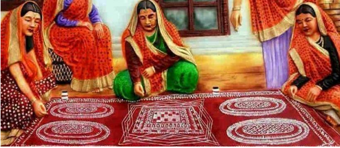
पारम्परिक लहंगा-पिछौड़े के साथ ऐपण तैयार करती उत्तराखण्डी महिलायें

एसोसिएट प्रोफेसर/विभागाध्यक्ष (शिक्षा शास्त्र), विद्यान्त हिन्दू पी.जी. कालेज, लखनऊ